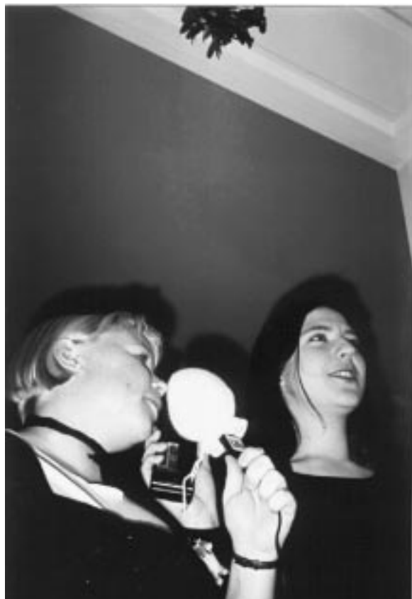
GHADdens reportrar väntar ivrigt under misteln...

Ni förstår väl vad dessa siffror står för...?