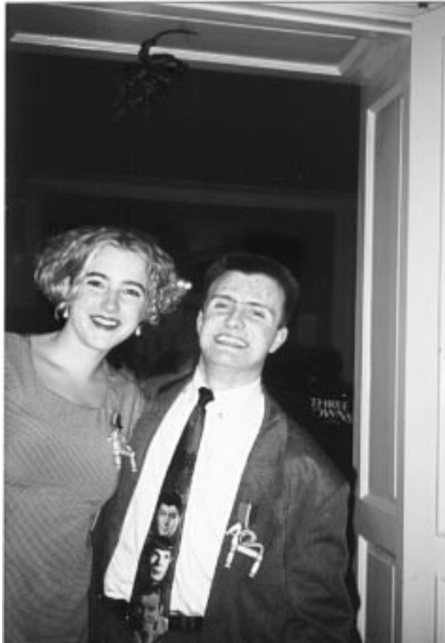
De stolta mottagarna av Brända Bockens Orden

Så var ännu ett lyckat nationsevenemang till ända.