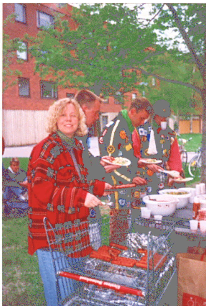
Den legendariska kundvagnsgrillen från Brännbollen -93